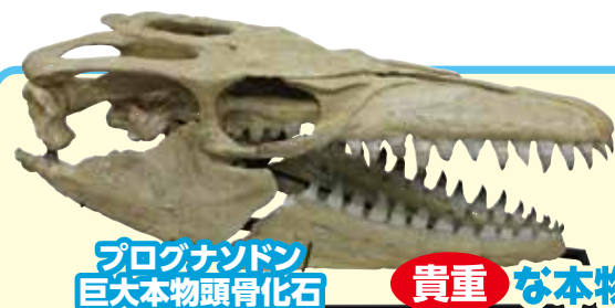
プログナソドン 巨大本物頭骨化石